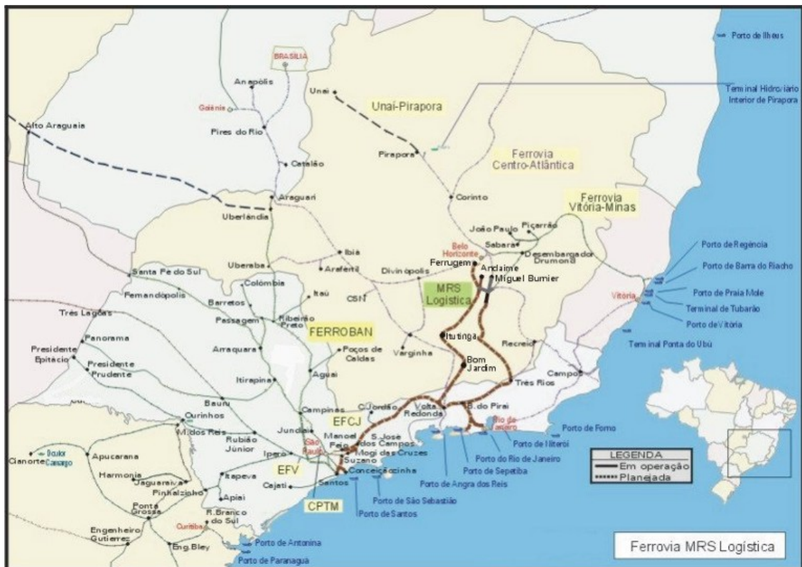
Figura 4: Mapa da MRS Logística S. A (ANTT, 2006).

Como descreve Rodrigues (2004, p. 63) essas interligações com as regiões metropolitanas das capitais citadas anteriormente, proporcionam um escoamento nos principais centros ferríferos mineiro para as usinas siderúrgicas. A figura 4 demonstra o mapa da MRS.