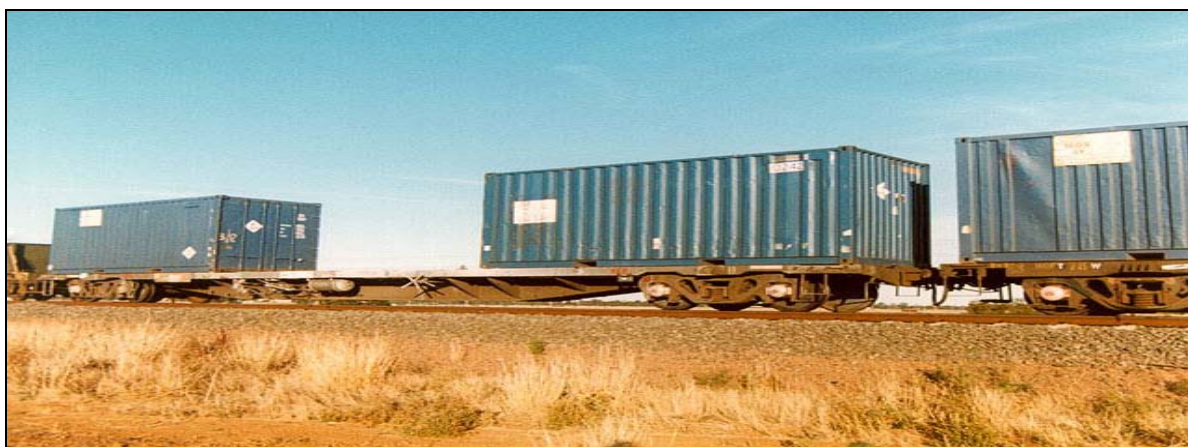
Figura 12: COFC.