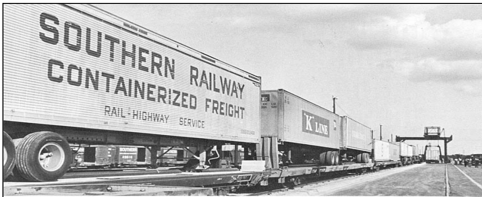
Figura 10: Estrutura Piggyback ( http://southern.railfan.net/ties/1973/73-7/charle.html , 2006)

De acordo com Ballou (2001, p. 127), o piggyback (figura 10) refere-se ao transporte por reboque de caminhão sobre semi-reboques rodo-ferroviários, geralmente até distâncias mais longas do que os caminhões normalmente rebocam.