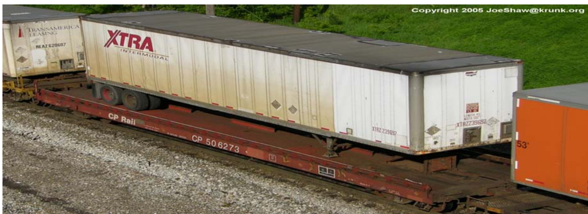
Figura 11: TOFC ( http://www.krunk.org/~joeshaw/pics/cp/flat.shtml , 2006).

O TOFC (figura 11) consiste, de acordo com Nazário (2000, p. 6), em colocar uma carreta semi-reboque sobre um vagão plataforma. Já o COFC (figura 12), caracteriza-se pela colocação de um contêiner sobre um vagão ferroviário. Essas operações evitam investimentos em equipamentos de movimentação nos terminais e como principal benefício reduz o tempo e custo no transbordo da carga.