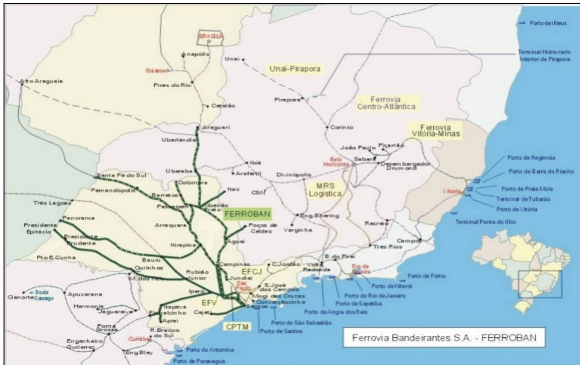
Figura 8: Mapa da Ferrovia Bandeirantes (ANTT, 2006)