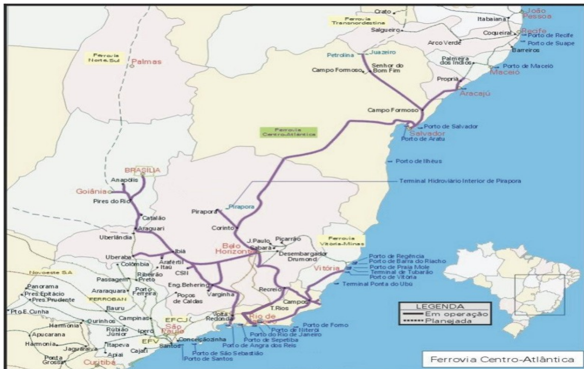
Figura 3: Mapa da Ferrovia Centro-Atlântica S. A (ANTT, 2006).

Conforme Rodrigues (2004, p. 64) este trecho cobre importantes centros produtores de aço, cimento, grãos, fertilizantes e indústria petroquímica, facilitando o escoamento desses produtos aos portos com uma grande redução sobre o custo do frete rodoviário. A figura 3 demonstra o mapa da FCA.