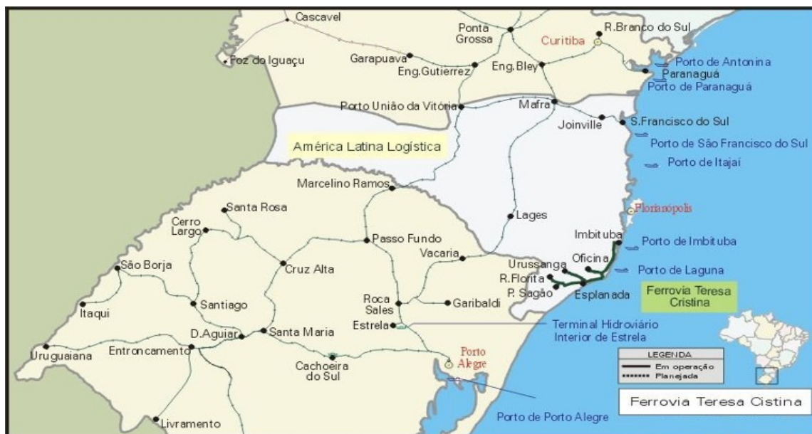
Figura 5: Mapa da Ferrovia Tereza Cristina S. A (ANTT, 2006).

Inicialmente, este trecho foi direcionado para o transporte de carvão, das minas do sul catarinense ao porto, atualmente, conforme descreve Rodrigues (2004, p. 60), a concessionária proporciona o abastecimento da Usina Termoelétrica Jorge Lacerda. A figura 5 demonstra o mapa da FTC.