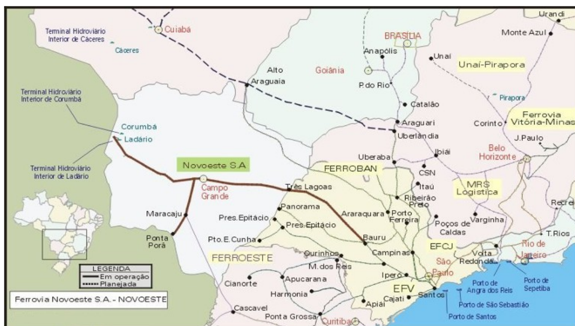
Figura 2: Mapa da Ferrovia Novoeste (ANTT, 2006).

Seu nicho mercadológico é o escoamento de derivados de petróleo, minérios e soja da região centro-oeste para os portos de Paranaguá e Santos. (RODRIGUES, 2004, p.62). A malha da Ferrovia Novoeste pode ser vista na figura 2.