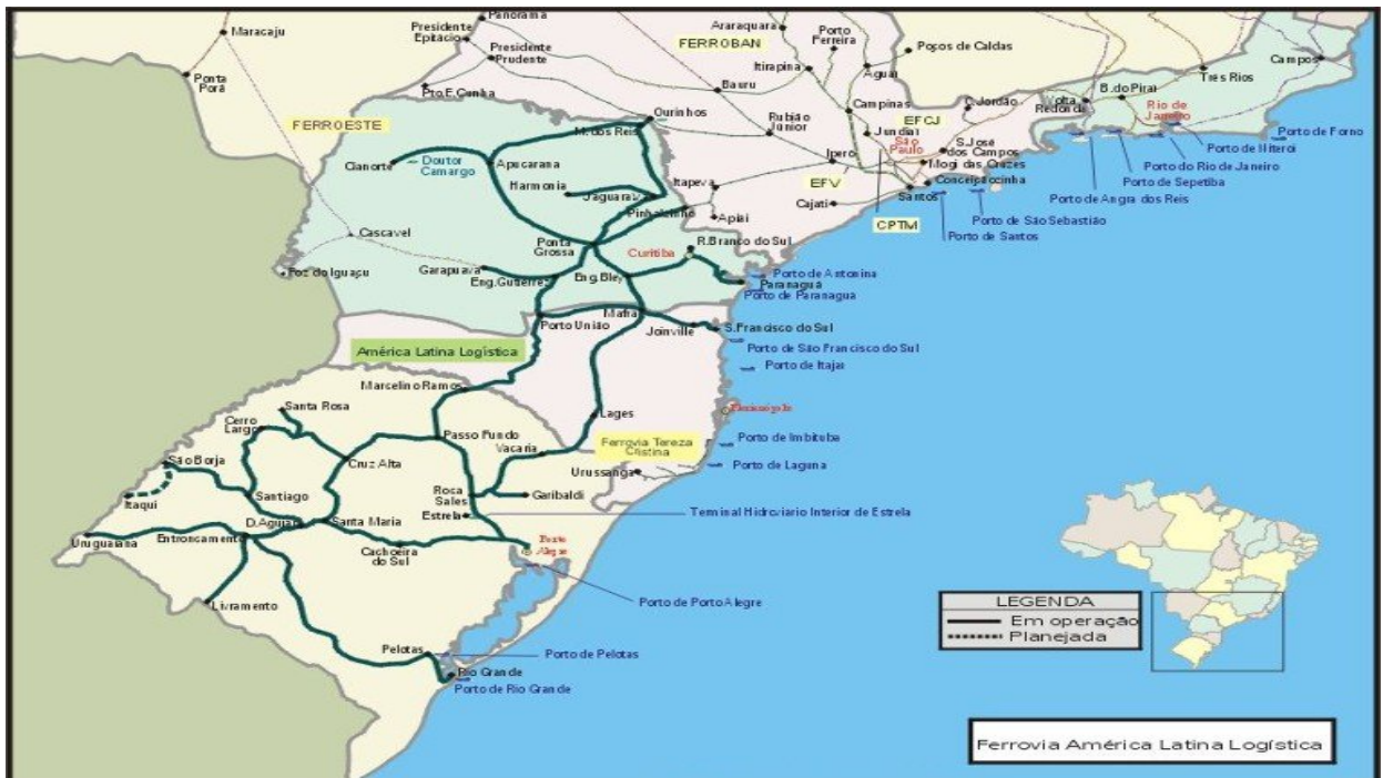
Figura 6: Mapa da América Latina Logística (ANTT, 2006).