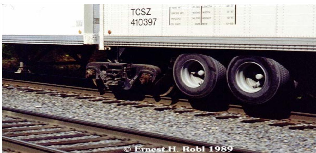
Figura 9: Sistema Roadrailer ( http://www.robl.w1.com/RoadRailer/l-890487.htm , 2006)

De acordo com Rodrigues (2004, p.58), o modal ferroviário, por suas características operacionais, apresenta vantagens, como: capacidade para transportar grandes lotes de mercadorias, fretes baixos, de acordo com o volume transportado, baixo consumo energético, adaptação ferro-rodoviária, rodo-trilho ou road-railer 1 (figura 9) e o provimento de estoques em trânsito.